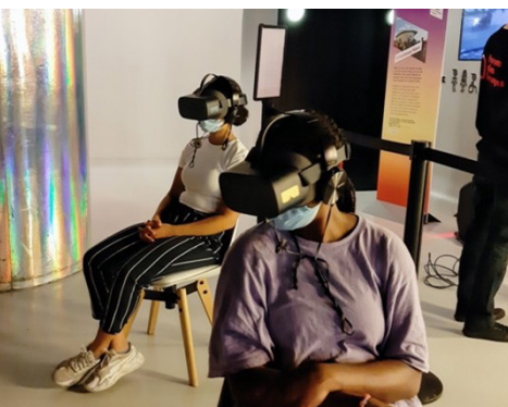
Promotion Wi-Filles, FACE Seine-Saint-Denis, 2021

FAVORISER LE POUVOIR D'AGIR DES FILLES ET BRISER LE CERCLE DES DISCRIMINATIONS GENRÉES