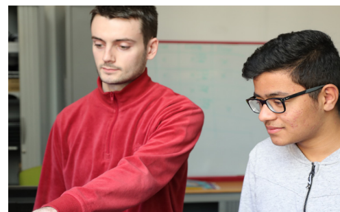
Stagiaire de 3 e me, Fondation FACE, 2019

En classe de 3 e me, la « séquence d'observation en milieu professionnel » constitue une première étape clé dans la construction d'un projet d'orientation. FACE accompagne les élèves et les entreprises pour les accueillir au mieux et garantir l'impact positif de cette première immersion professionnelle. Elle permet aux jeunes d'appréhender concrètement et avec confiance le monde professionnel.