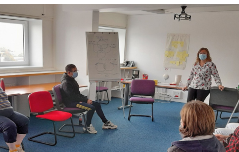
Atelier Job Academy, FACE Loire-Atlantique, 2021

En 2020-21, 6 500 élèves accompagnés et préparés ont pu réaliser un stage de 3 e me